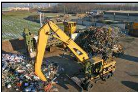
Foto 1 – Semovente con benna a polipo durante movimentazione di rottami