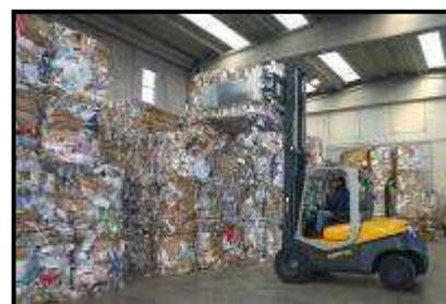
Foto 6 – Deposito di balle di carta in attesa di trasporto al cliente